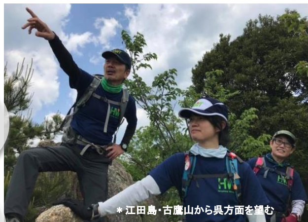
* 江田島・古鷹山から呉方面を望む