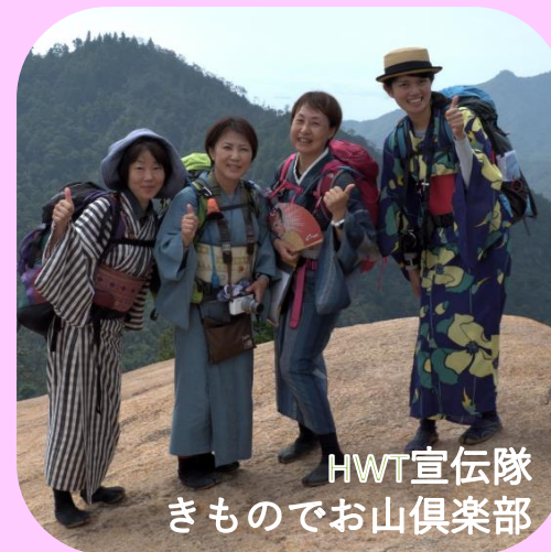
HWT宣伝隊 きものでお山倶楽部